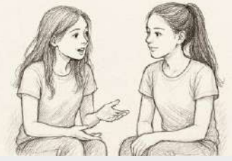
हिमसंस्कृतवार्ता: ईदधीरज, हैदराबाद