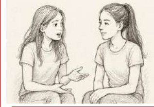
हिमसंस्कृतवार्ता, ईदरधीरजः, हैदराबादः

एका एव रज्जुः उभयकोटिं बध्नाति चेत् ततः मोक्षः न भवति। एवम् अग्रे कूपः पृष्ठे गतः इति वत् यदा सर्वथा अगतिः भवति तदा तस्य वर्णनं कर्तुम् अस्य न्यायस्य प्रयोगः क्रियते। यथा- अ) यद्यपि न बोधस्तथापि विकल्पस्तावत् प्राप्नोति। न हि तुल्यार्थानां क्वचित् समुच्चयो दृष्टः। सेयम् उभयतस्याशा रज्जुः। सर्वदर्शनसंग्रहे बौद्धदर्शनम् {२८२} डा वर्षा प्रकाश टोणगांवकर पुणे/ महाराष्ट्रम्