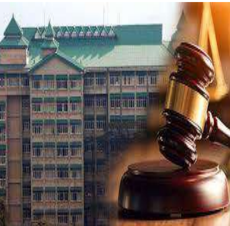
शिमला (हिमाचलप्रदेशः): हिमाचलप्रदेशस्य