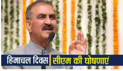
हिमाचल दिवस | सीएम की घोषणाएं