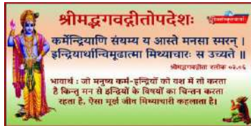
श्रीमद्भगवद्गीतोपदेशः कर्मन्दिष्याणि संयम्य य आस्ते मनसा स्मरन् । इन्द्रियाणां चिन्मूढता मिथ्याचारः स उच्यते ॥ भावार्थः - जो मनुष्य कर्म-इन्द्रियों को वश में तो करता है किन्तु मन से इन्द्रियों के विषयों का चिन्तन करता रहता है, ऐसा मूढ़ जीव मिथ्याचारों का हलाल है। श्रीमद्भगवद्गीता लक्ष्मी-चन्द्रिका