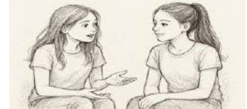
हिमसंस्कृतवार्ता, ईदधौराज, हैदराबाद