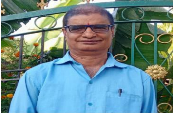
असमप्रदेशीय: विज्ञानशिक्षक, नारदोपाध्याय: