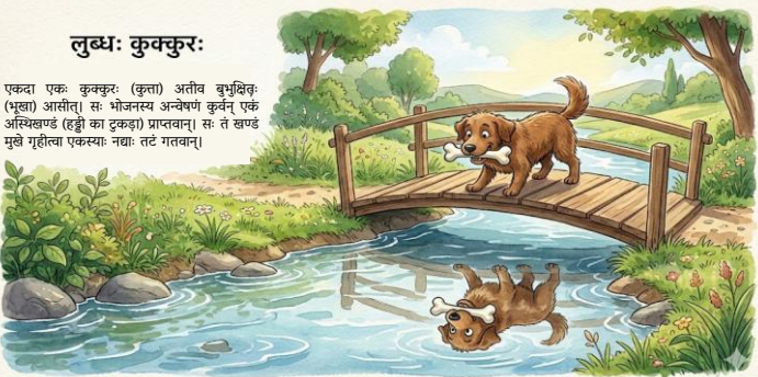
लुब्धः कुक्कुरः एकदा एकः कुक्कुरः (कुत्ता) अतीव बुभुक्षितः (भूखा) आसीत्। सः भोजनस्य अन्वेषणं कुर्वन् एकं अस्थिखण्डं (हड्डी का टुकड़ा) प्राप्तवान्। सः तं खण्डं मुखे गृहीत्वा एकस्याः नद्याः तटं गतवान्।

कुक्कुरः अस्ति, तस्य मुखे अपि एकः अस्थिखण्डः अस्ति। यदि अहं तस्य खण्डम् अपि प्राप्नोमि, तर्हि मम आनन्दः द्विगुणः भविष्यति।" एवं विचिन्त्य सः लोभेन अभिभूतः अभवत्। सः तं अन्यं कुक्कुरं भीतयितुं (डराने के लिए) भक्षणम् (भौकना) आरब्धवान्। यथैव सः मुखम् उद्घाटितवान् (खोला), तस्य मुखात् सः अस्थिखण्डः जले अपतत्। कुक्कुरः अतीव दुःखी अभवत्। सः रिक्तहस्तः एव अतिष्ठत्। शिक्षा (Moral) "लोभः पापस्य कारणम्।" (लालच पाप और दुःख का कारण होता है।)