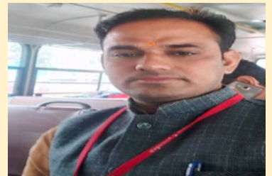
यत्र रत्नस्य संशोभते पद्मिनी, भाति सा किन्न राजस्थली भारते।१०॥

यत्र गोविन्ददेवो दयासागरो, यत्र लीला-विलासो मनोहारकः। यत्र भक्तार्थदाताऽखिलानन्ददो, भाति सा किन्न राजस्थली भारते।७॥ यत्र भक्तप्रियः पञ्चरोपान्धरो, यत्र युद्धे प्रवीणश्च शूरो वरः। राजते यत्र खाटूनरेशप्रभुर् भाति सा किन्न राजस्थली भारते।८॥ यत्र सालासरे विद्यते पावनो, जानकीजानिदासो भृशं शोभनः। दीनरक्षार्थिर्दा वज्रदेहो बली, भाति सा किन्न राजस्थली भारते।९॥ यत्र राणाप्रतापो जनिं लब्धवान्, यत्र पीतं विषं वै मुदा मीरया।