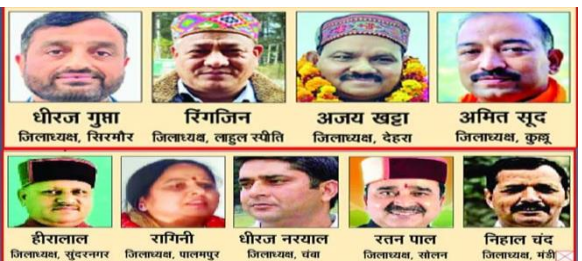
भाजपायाः नवजिल्हेषु घोषिताः अध्यक्षः।