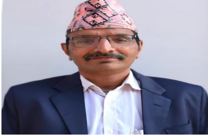
हिमसंस्कृतवार्ता: -शिवराजभट्टः, नेपालः