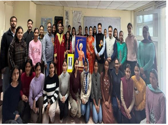
सरदारपटेलविश्वविद्यालये बिरसामुण्डा जयन्त्यावसरे समामूहिक चित्रे

हिमाचले गृहवासनीतिः २००८ तमे वर्षे निर्मिता। तत्कालीनसर्वकारेण युनां स्वरोजगारस्य उद्देश्यं कृत्वा एषा नीतिः आनीता आसीत्। पूर्वं गृहवासः त्रिषु कक्षेषु चालयितुं शक्यते स्म, पश्चात् ५ कक्षेषु वर्धितः।