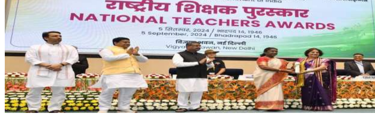
राष्ट्रीय शिक्षक पुरस्कार NATIONAL TEACHERS AWARDS 5 सितंबर, 2024 / अक्टूबर 14, 1946 5 September, 2024 / October 14, 1946 विज्ञान भवन, नई दिल्ली Vigyan Bhawan, New Delhi