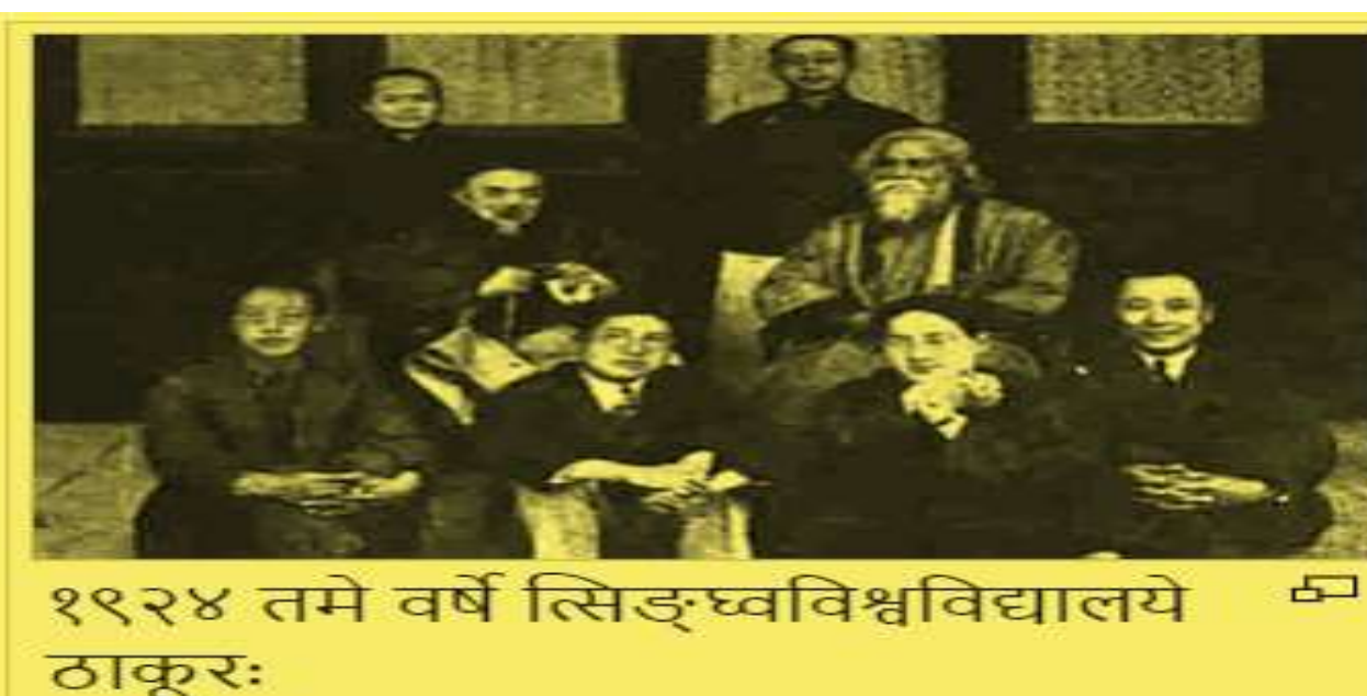
१९२४ तमे वर्षे सिङ्घविश्वविद्यालये ठाकूरः