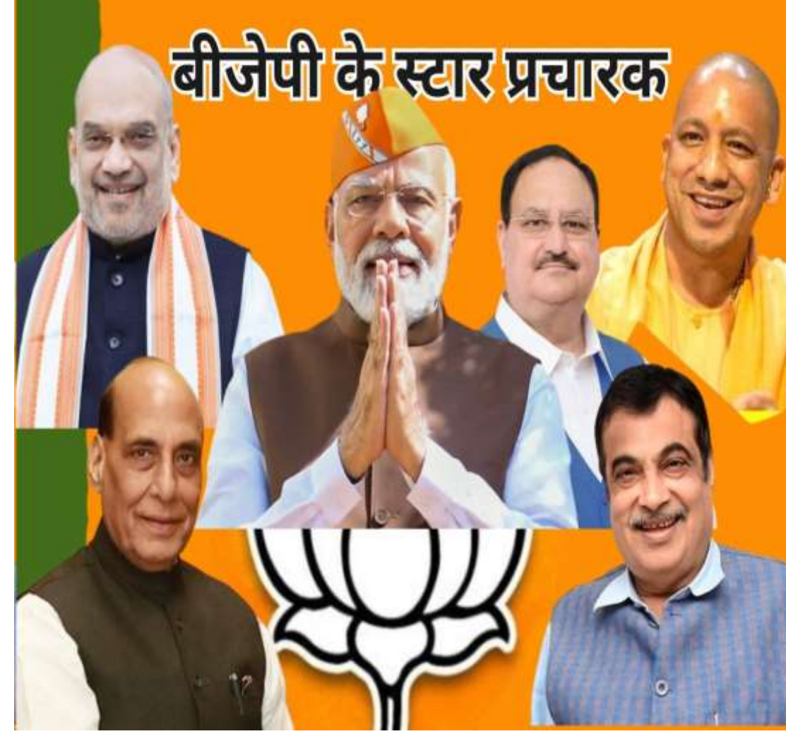
बीजेपी के स्टार प्रचारक