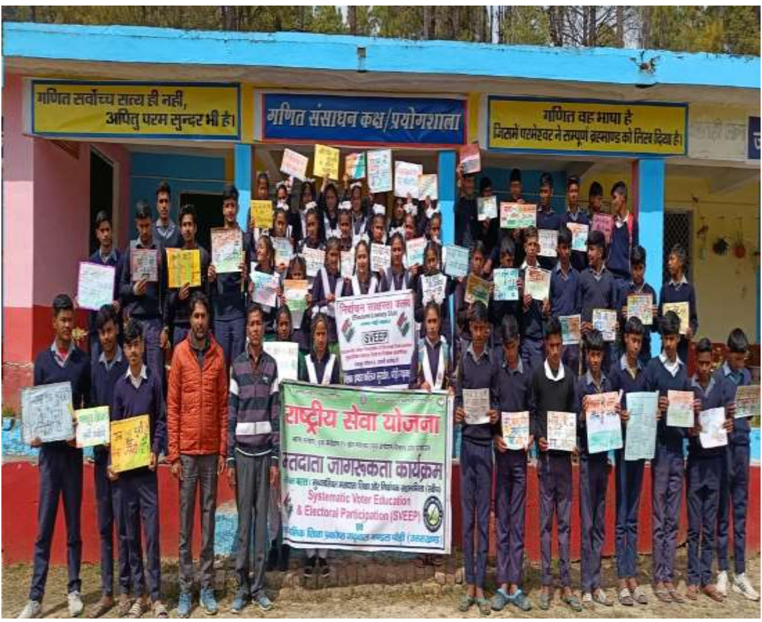
हिमसंस्कृतवार्ता: कुलदीपमैन्दोला। उत्तराखण्ड।

आगामीलोकसभासामान्यनिर्वाचनस्य -2024 वर्षस्य प्रत्येकमतदातृणां शतप्रतिशतं प्रतिभागः भवेत् तदर्थं उत्तराखण्डस्य पौड़ीजनपदेपि जनजागरणाय विद्यालयेषु अपि मतदाताशपथं च जागरणकार्यक्रमः जायमानः विद्यते। भागं सुनिश्चितं कर्तुं श्रीमान् जिलाधिकारी महोदयः / जिला निर्वाचनाधिकारी पौड़ी गढ़वालं तथा मुख्यविकासधिकारी पौड़ी गढ़वालं / अधिकारी निर्वाचनायोगस्य अनुसारेण दिशानिर्देशं प्रयच्छन्ति।