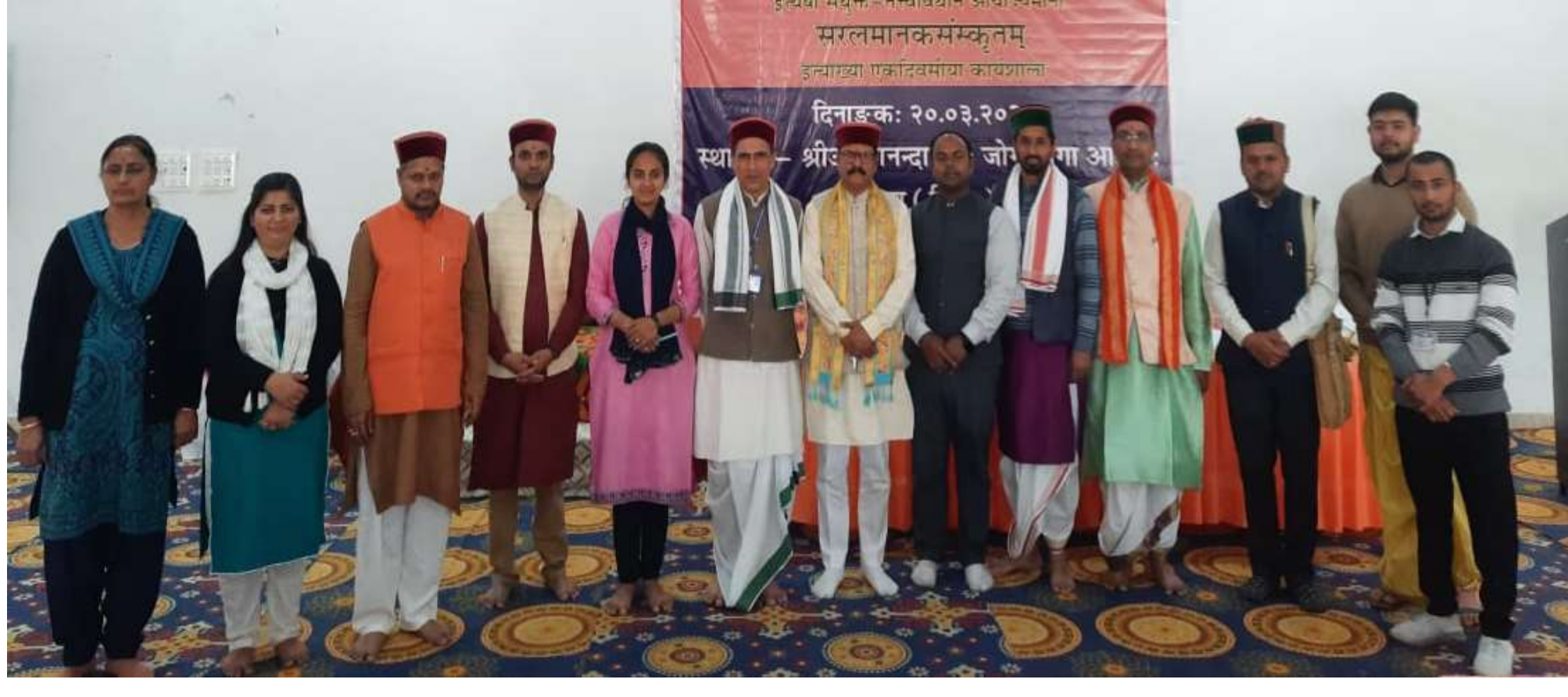
सरलमानकसंस्कृतम् इत्यस्यां कार्यशालायाः प्रतिभागिनः सामूहिके चित्रे