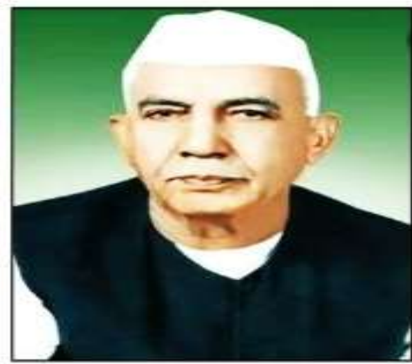
पूर्व प्रधानमंत्री श्री चौधरी चरण सिंह जी