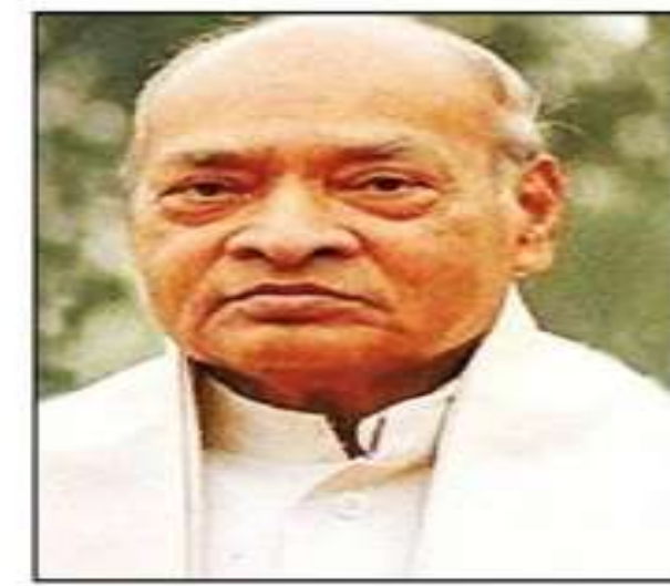
पूर्व प्रधानमंत्री श्री पीवी नरसिंहा राव जी

पी वी नरसिंहारावाय, चौधरीचरणसिंहाय, एम. एस. स्वामीनाथनाय च देशस्य सर्वोच्चसम्मानं भारतरत्नं दातुं घोषणा