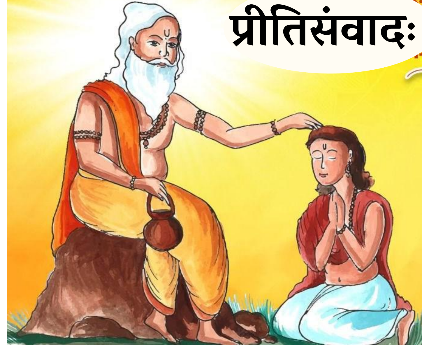
असमप्रदेशीयः विज्ञानशिक्षकः नारदोपाध्यायः,